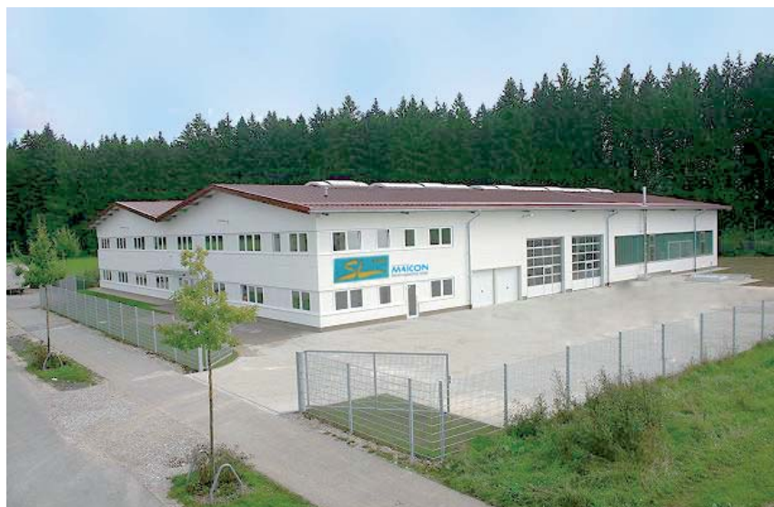
Firmengebäude in Traunreut / Bayern Headquarter in Traunreut / Bavaria Siège social à Traunreut / Bavière