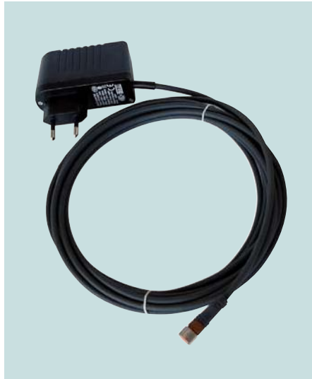
Steckernetzteil mit 5m Kabel Power supply with 5m cable Alimentation avec 5m de câble