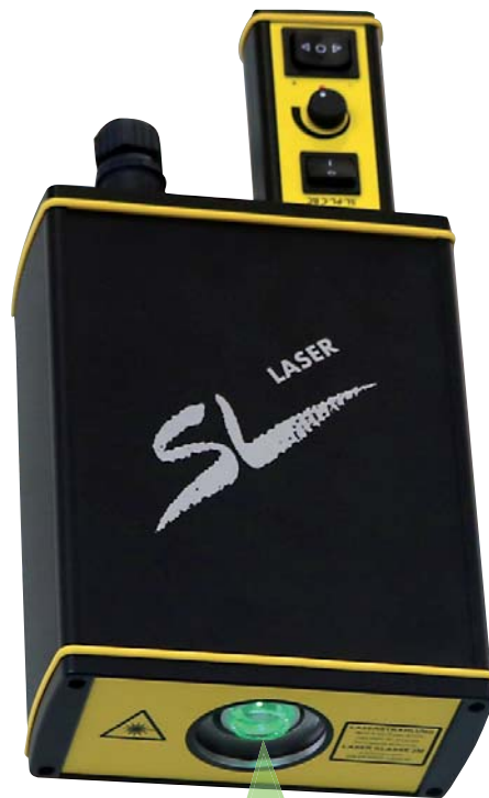
Kreislaser Circle Laser Laser circulaire