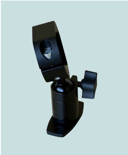
Halterung für Positionierlaser Holder for positioning laser Support pour laser de positionnement