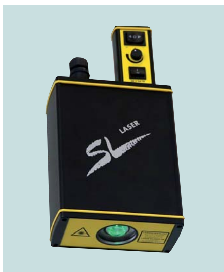
Kreislaser Circle Laser Laser circulaire