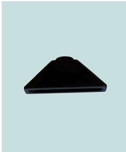
Blendenaufsatz für Positionierlaser Orifice attachment for positioning laser Limiteur de ligne