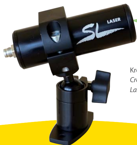
Kreuzlaser Cross laser Laser croix