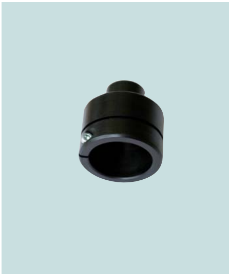
Adapter für Positionierlaser Adapter for positioning laser Adaptateur pour laser de positionnement