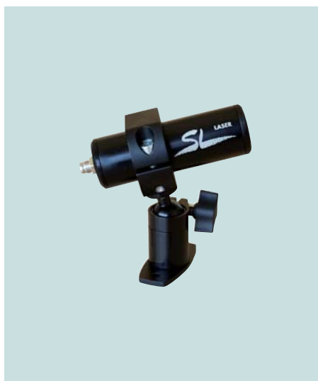
Positionierlaser mit Halterung Positioning laser with holder Laser de positionnement avec support