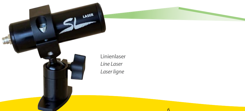
Linienlaser Line Laser Laser ligne