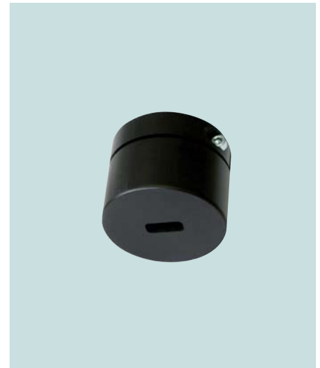
Blendenaufsatz für Positionierlaser Orifice attachment for positioning laser Limiteur de ligne