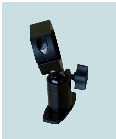
Halterung für Positionierlaser Holder for positioning laser Support pour laser de positionnement