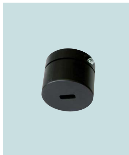
Blendenaufsatz für Positionierlaser Orifice attachment for positioning laser Limiteur de ligne