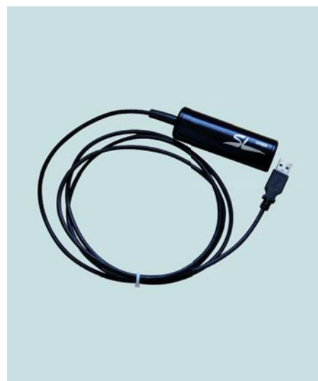
Positionierlaser mit USB Kabel Positioning laser with USB cable Laser avec câble USB