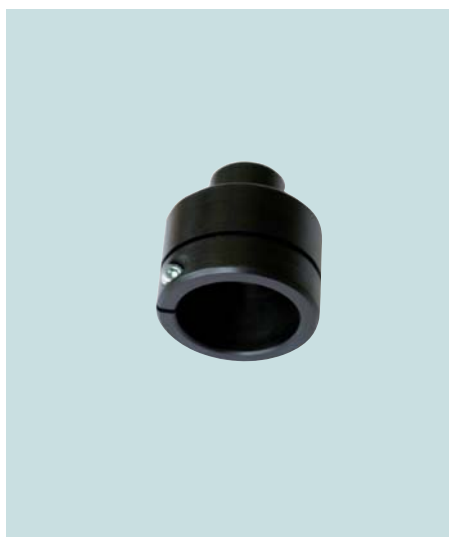
Adapter für Positionierlaser Adapter for positioning laser Adaptateur pour laser de positionnement