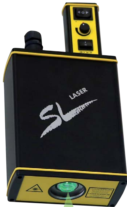
Kreislaser Circle Laser Laser circulaire